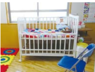
個室のように利用できますので、気兼ねなく授乳することができます。

個室のように利用できますので、気兼ねなく授乳することができます。S サイズからビッグサイズまで揃ったオムツ、消毒されたベッドやミルク用のお湯などが用意されており、充実した設備となっています。また遊具や絵本もありますので、ついつい長居してしまいそうです。