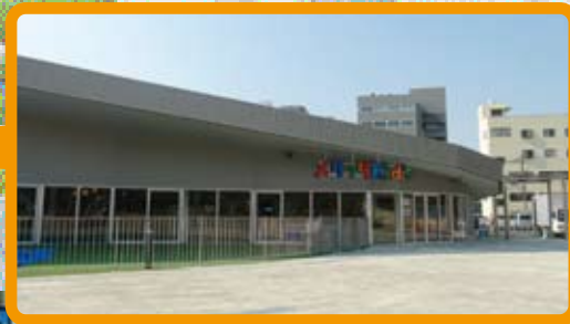
メリッタ Kid's SASEBO