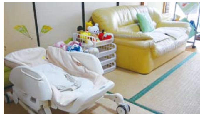
和室で落ち着いた部屋。ベッドやお昼寝マット、遊具、ミルク用のお湯も用意されており、ゆっくりと休憩ができます。

佐世保市の繁華街の中心に位置していますが、実際に行ってみると緑に囲まれた静かな環境にあります。園庭では元気に遊び回る園児の姿が見られますが、園児と職員の方々と一緒に季節による野菜や花も育てられており、この活動が食育にもつながっているそうです。