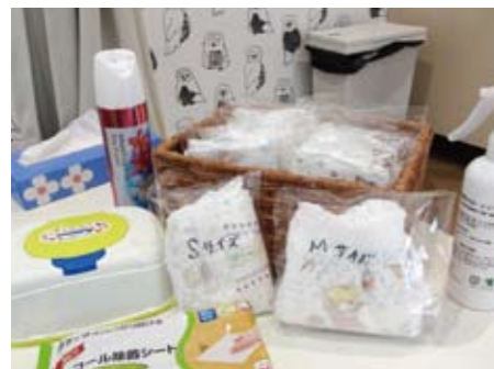
オムツ S サイズ・M サイズと常備されています。おしりふきやアルコール除菌シートも揃っています。

この部屋には、2種類のサイズのオムツを使用できるよう用意されていますので、おむつの替えがなくなっても安心ですね。そしてミルク用のお湯が利用できるのも嬉しいですね。外出時にお湯を忘れても大丈夫！ミルクも用意できるので安心できます。