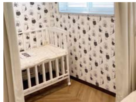
抗菌済みのベビーベッド。オムツ替えも楽にできます。