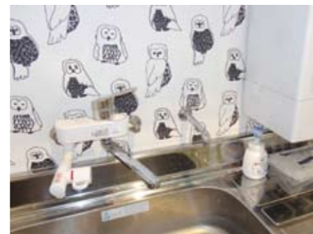
お湯も利用できます。ミルクを作るお湯を忘れて外出しても安心です。

こういった子育て支援も、常日頃地域貢献活動に積極的に取り組まれているトヨタカローラ長崎佐世保相浦店ならではのサポートですね。マイカーの充電や通りかかった際にでもお子さんと一緒に立ち寄ってみませんか？